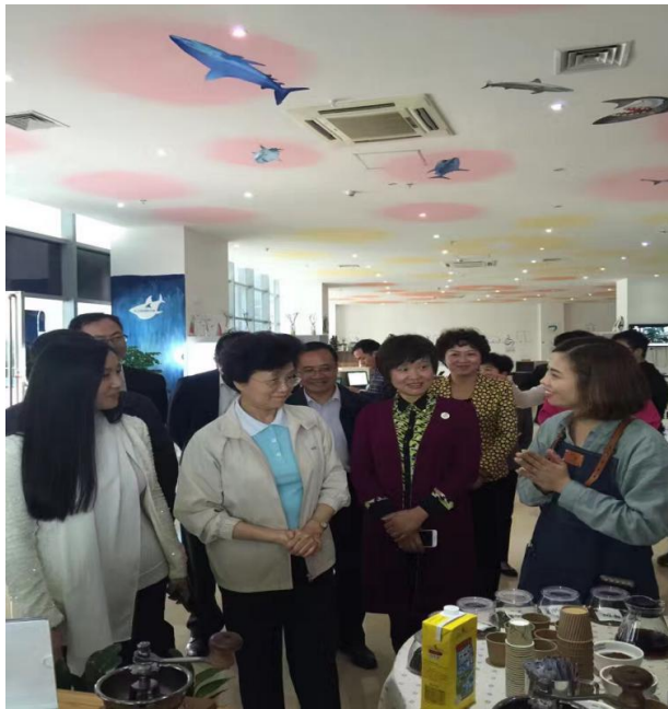
全国妇联党组书记宋秀岩莅临长江鲨调研指导

创服务思路、创新双创服务产品及合作模式），来实现让创业更简约、创新更高效、创造更美好。