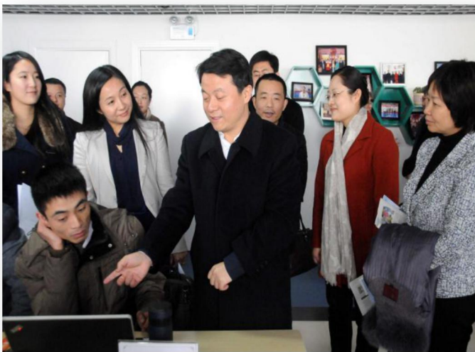
原团中央书记处书记傅振邦莅临长江鲨调研指导

在“大众创业、万众创新”国家战略发展规划指引下，安徽长江七号网络科技有限公司于2015年1月设立长江鲨众创空间，于2015年6月被纳入国家级科技企业孵化器体系，成为全国首批136家国家级众创空间之一，“联结精英创业、服务名企创新”是其名片。